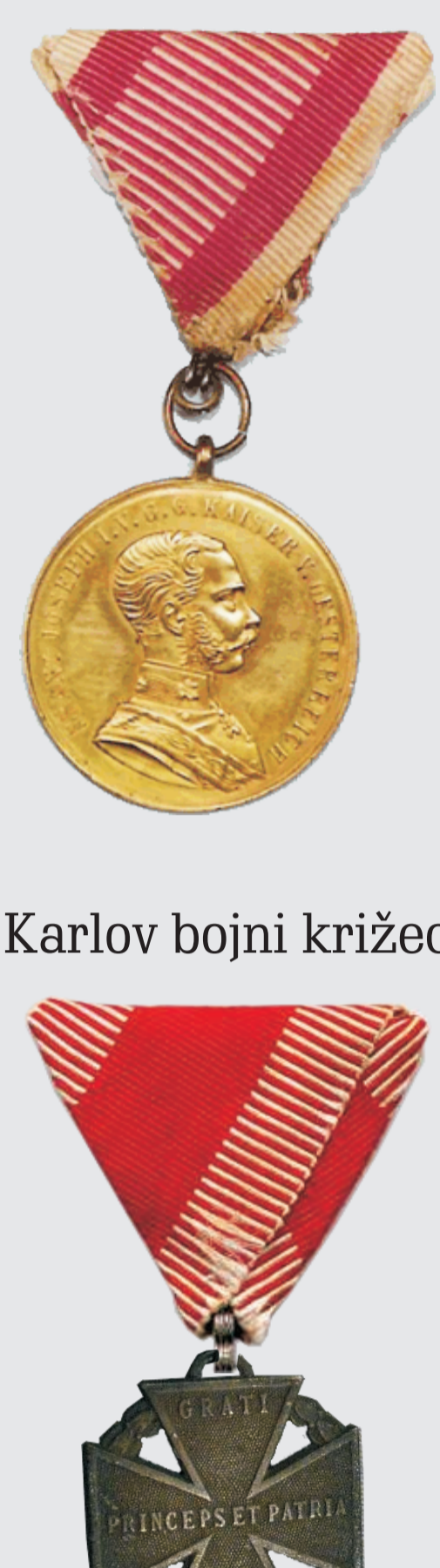
Karlov bojni križec